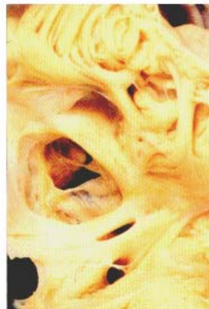
fig05-3a - Microsoft Int...

As deficiências do septo atrial que permitem passagem de sangue à primeira vista, entre as malformações cardíacas congênitas, a comunicação interatrial é parte integrante da circulação fetal, necessariamente, pois o sangue ricamente oxigenado vindo da veia cava inferior alveolar chega ao coração e, portanto, o encéfalo em desenvolvimento. As malformações interatriais representam persistência dessa situação e são chamadas de comunicações interatriais (figura 5.1). Isto não é verdadeiro para os defeitos morfologicamente chamados de comunicações interatriais, mas estão fora do escopo deste capítulo. Portanto, nem todas as comunicações interatriais são verdadeiras comunicações do septo atrial.